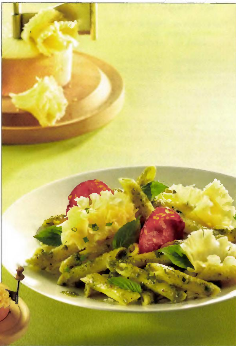
Les fromages de Suisse